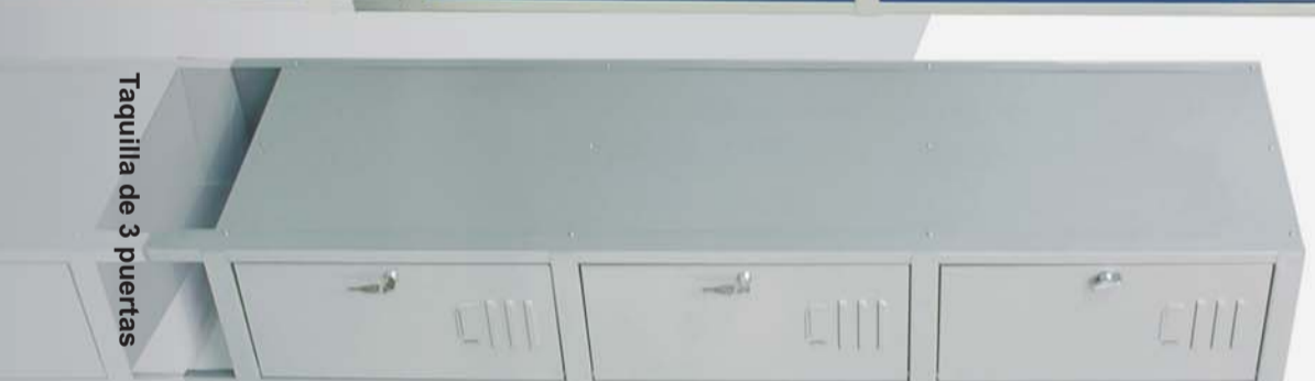
Taquilla de 3 puertas