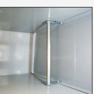
BARRA DE PERCHERO

La opción base de zócalo, confeccionado de acero inoxidable, mejora el acabado de la taquilla y facilita la limpieza del local.