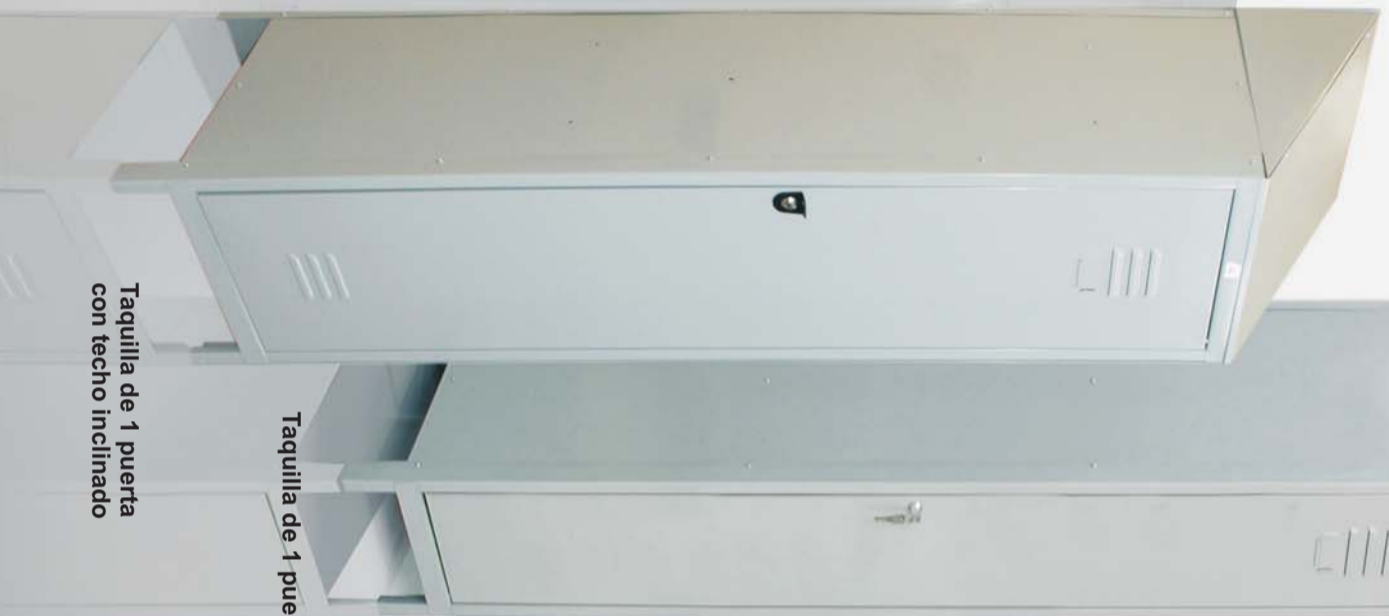
Taquilla de 1 puerta