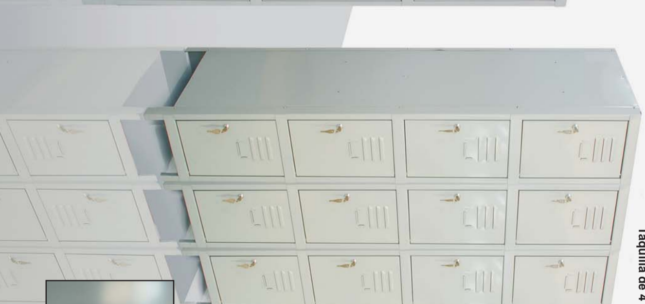
Taquilla de 4 puertas